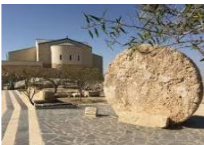
MONTE NEBO- BASILICA DI MOSE'