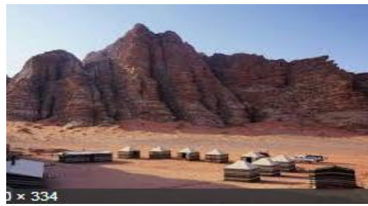
CAMPO TENDATO DESERTO DI WADI RUM